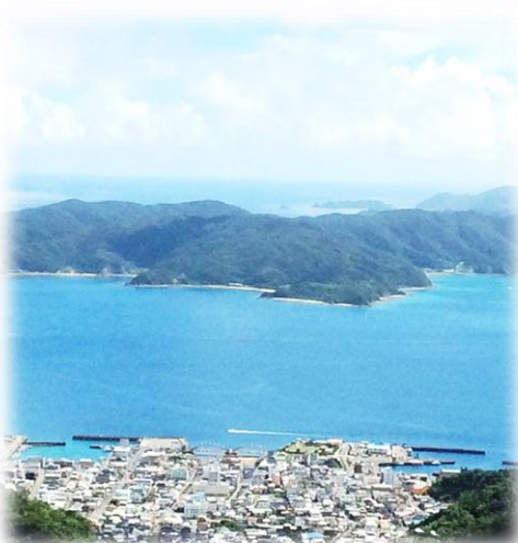
油井岳展望所(正面:加計呂麻島)