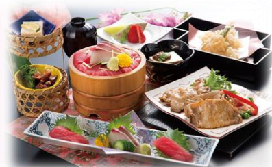
昼食：特製春の幸せ御膳 (イメージ図)

可睡齋(かすいさい)ひなまつりでは、国登録有形文化財瑞龍閣において日本最大級の32段1,200体のおひな様をご覧ください。その他2,000体のさるぼぼ(つるし飾り)や室内ぼたん園も会場を鮮やかに彩ります。今年も楽しい春の1日を一緒にしませんか？